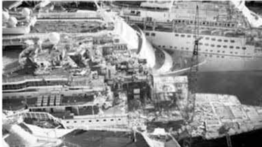
Turkey's Alaga, cruise graveyard, final destination where cruise ships make their last journey

Now many once proud vessels are heading for a ship's graveyard in Turkey where they lie crammed