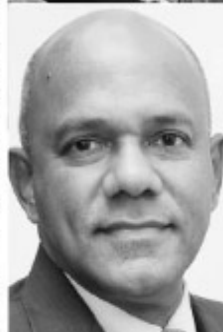
General Daya Ratnayake chairman, Sri Lanka Ports Authority

and systematically disinfected. Randomly selected teams working and engaging at various capacities in the Port of Colombo and other ports in the country are regularly subjected to PCR and antibody tests. The medical advice given on the results of those tests is facilitated to be followed in the same manner.