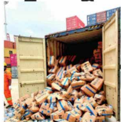
මාධ්‍ය ප්‍රකාශකවරයා වැඩිදුරටත් සඳහන් කළේය, ඒ අනුව මෙම ඔහාලුම ශ්‍රී ලංකාවට ආනයනය කළ පාර්ශ්වකරුවන් 07දෙනෙකු සොයා මේ පිළිබඳව වැඩිදුර විමර්ශන කරමින් අරඹා කර තිබේ.

මෙම සිදුවීම මගින් රජයට රුපියල් කෝටි 04කට අධික මුදලක් මෙම ආනයනයකරුවන් වංචා කර ඇති බව රේගුව ගණන් බිලා ඇති බව රේගු