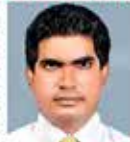
By Vidushan Premathirathne, CFA

potential leadership of the country over a number of years.