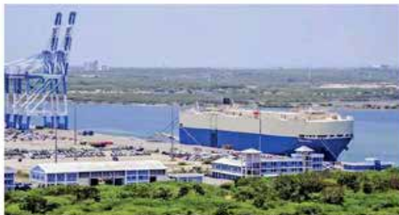
It is clear that China has resorted to financing infrastructure projects with the intention of clearing them in the case of default. This was the fate of the Hambantota Port that was surrendered to avoid default on the loans from China.

It is frequently perceived that the Chinese-led initiative were strongly crafted in a manner that was able to exploit the fragile family-led political leadership of that time. The established dictatorship style driven leadership of the SLPP during 2005-2015 was not able to clearly understand the feasibility of such infrastructural nature that the Chinese were keen to fund. In addition, they were not able to foresee the repercussions of such loans would have in the future, given the low performance of the development.