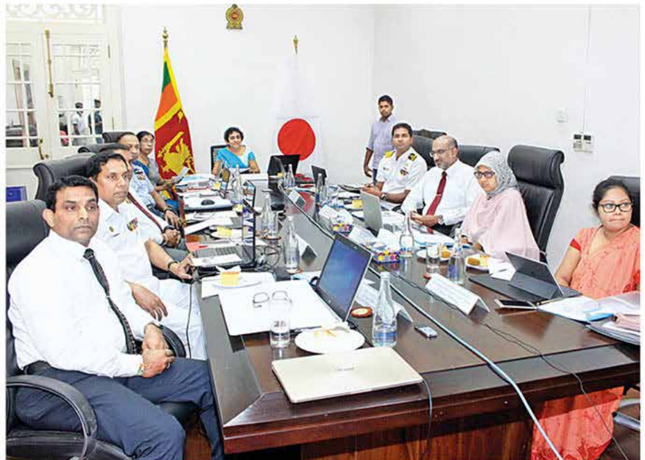
Participants at the virtual dialogue.

Discussions were held on multilateral maritime initiatives spread across the Indo-Pacific region. Sri Lanka highlighted the need to further strengthen bilateral and multilateral cooperation for a rule-based maritime order as a vital element for stability and prosperity in the region. Sri Lanka also noted on the need for quality infrastructure development, as a prerequisite