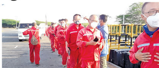
Precautions taken at the Hambantota Port for Coronavirus.

With the coronavirus epidemic becoming a serious cause for concern, the Hambantota International Port (HIP) has put in place several measures to ensure the safety of its staff, environment and the public.