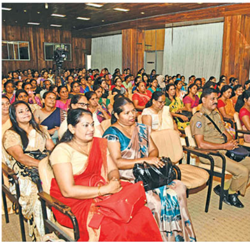
Part of the audience at the occasion