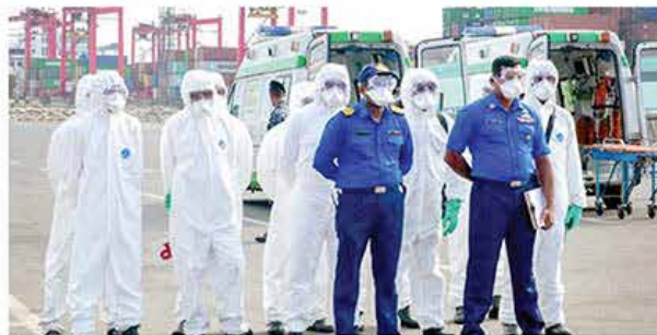
The drill in progress