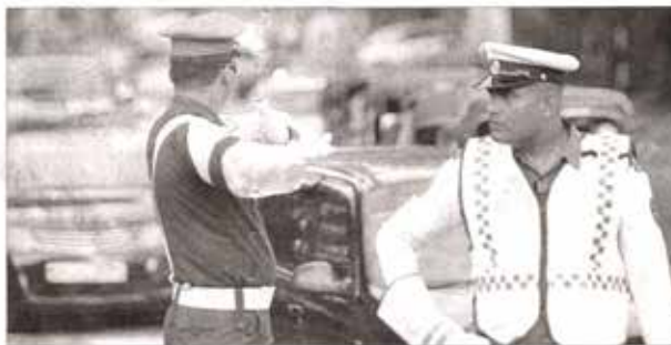
හමුදා සාමාජිකයන්ගේ පත්වීම්