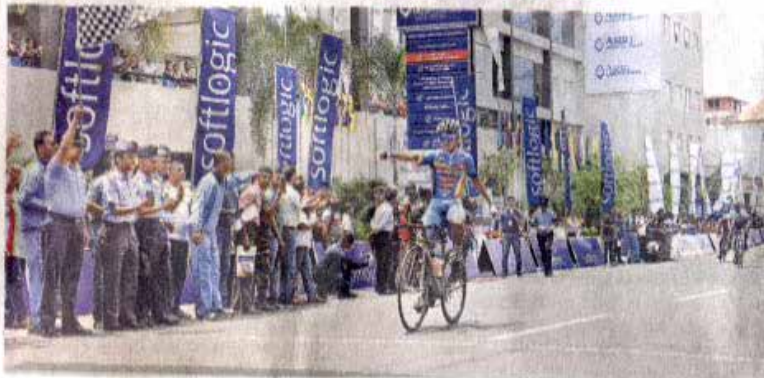
ජයග්‍රාහී සංජු දිමත්ත අදියර -1 නිමාවට ළඟා වූ අයුරු

සුදු කමිසය පැළඳ දෙවැනි අදියරට සහභාගීවීමේ සුදුසුකම් නිමිකර අදියර - 1 නොදැම යොවුන් ක්‍රීඩකයාට (වයස 23ත් පහළ) රියේ සම්මාන නිමිකර ගත්තේ තරුණ නිර්මාණය, ඒ 'ස්ටැර්ඩයි'