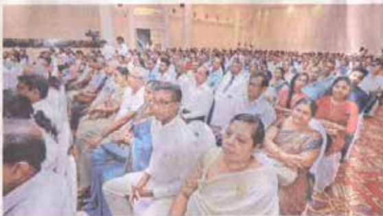
Some of the awardees and attendees during the ceremony

such as the development of the port of Galle, the development of the Trincomalee harbour, have been commenced," he further noted.