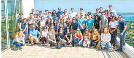
A group of second-year MBA students from the Harvard Business School visiting the Hambantota International Port

HIP has facilitated similar familiarisation tours for several educational institutions and professional bodies to observe their