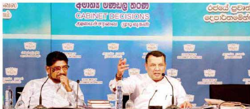
Cabinet Spokespersons Mahinda Samarasinghe and Keheliya Rambukwella

The Cabinet of Ministers under President Maithripala Sirisena and newly appointed Prime Minister Mahinda Rajapaksa, which met for the second time this week, approved charges levied by Sri Lanka Ports Authority and Jaya Container Terminals to increase competitiveness, while also introducing a unified fee levying