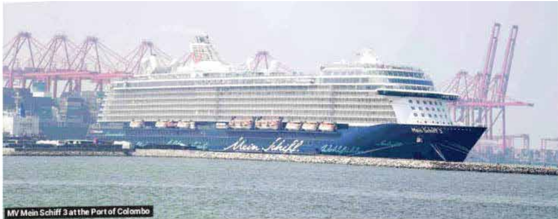
MV Mein Schiff 3 at the Port of Colombo