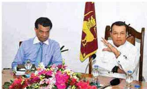
Chairman of Sri Lanka Ports Authority (SLPA) Dr. Parakrama Dissanayake and Minister of Ports and Shipping Mahinda Samarasinghe briefing on the latest growth of the Port of Colombo at a recent progress evaluation meeting.

During the first nine months of 2018, the Port of Colombo handled 4,206,630 TEUs of trans-