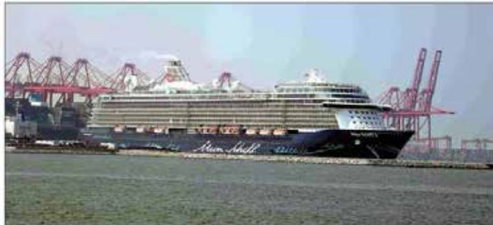
MV Mein Schiff 3 at the Port of Colombo

The concept is for German-speaking customers who opt for a premium cruise experience.