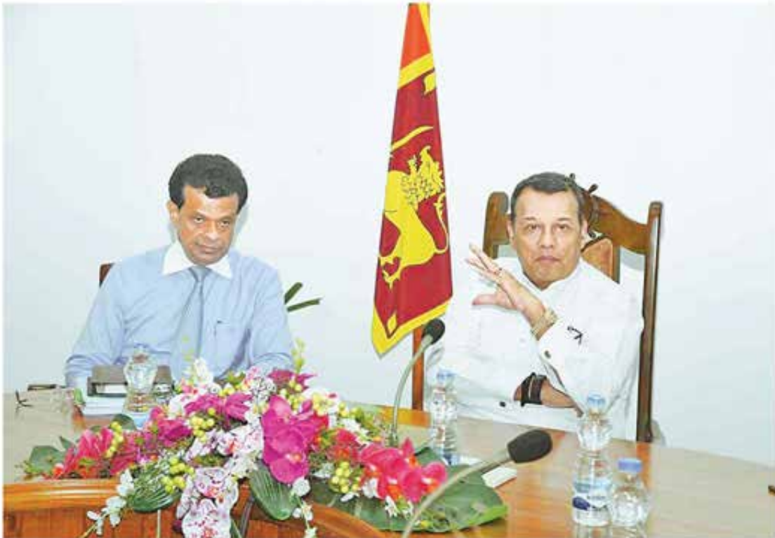
කොළඹ වරායේ බහලු මෙහෙයුම් තවදුරටත් ඉහල නැංවීමත්, කොළඹ වරාය ආසියාවේ කේන්ද්‍රීය වරායක් බවට පත් කිරීමත් සඳහා අපේක්ෂිත ඉදිරි සංවර්ධන කටයුතු වඩාත් වේගවත් කිරීමට වරාය හා නාවික ඇමැති මහින්ද සමරසිංහ මහතා ශ්‍රී ලංකා වරාය අධිකාරියේ සභාපති ආචාර්ය පරාක්‍රම දිසානායක මහතා සමඟ සාකච්ඡා කළ අයුරු.