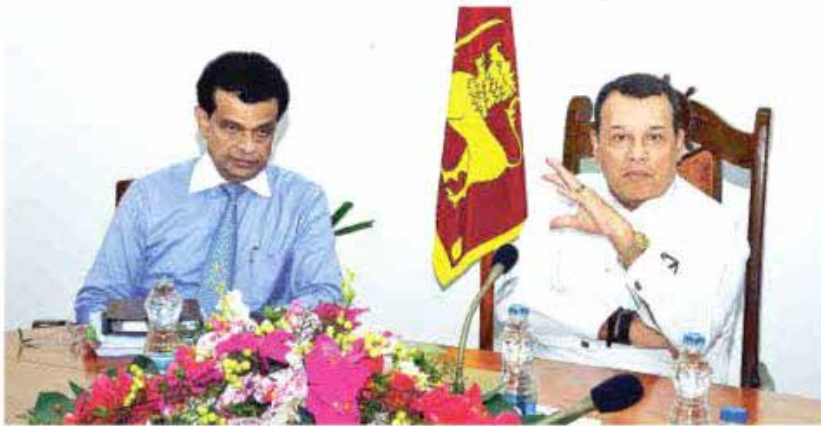
The Chairman of Sri Lanka Ports Authority (SLPA) Dr Parakrama Dissanayake and Minister of Ports and Shipping Mahinda Samarasinghe brief on the latest growth of the Port of Colombo at a recent progress evaluation meeting

The State-owned Jaya Container Terminal (JCT) of Sri Lanka Ports Authority (SLPA), witnessed the highest growth of 23.3% in transshipment container throughout for the first nine months (from January to September) in 2018 as against the corresponding period in 2017, a press release stated. During the first nine months of 2018, the transshipment volume handled by Jaya Container Terminal (JCT) reached 1,445,424 TEUs compared to 1,172,542 TEUs handled for the same period in 2017.