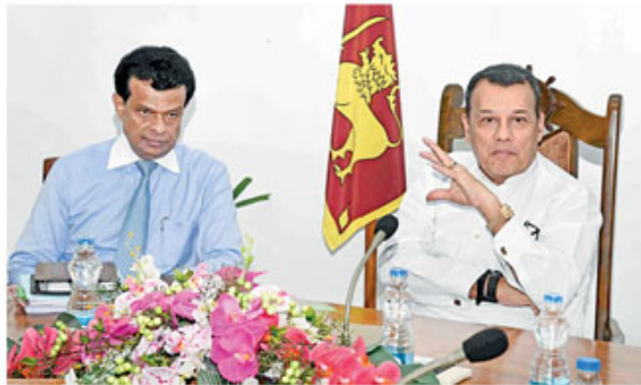
SLPA Chairman Dr. Parakrama Dissanayake and former Minister of Ports and Shipping Mahinda Samarasinghe

The state-owned Jaya Container Terminal (JCT) of Sri Lanka Ports Authority (SLPA) witnessed growth of 23.3% in transshipment container throughput for the first nine months (from January to September) in 2018 as against the corresponding period in 2017. During the first nine months of 2018, the transshipment volume handled by Jaya Container Terminal (JCT) reached 1,445,424 TEUs compared to 1,172,542 TEUs handled for the same period in 2017.