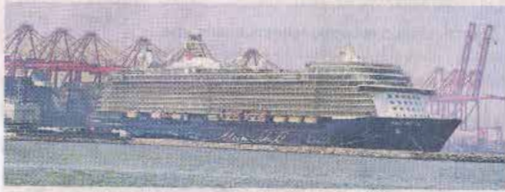
MV Mein Schiff 3 at Port of Colombo

TUI Cruises is a Germany-based, joint venture cruise line of German tourist firm TUI AG and American cruise line operator Royal Caribbean Cruises Ltd. The company commenced operations in 2009 targeting the German clientele, as an alternative to AIDA Cruises and Hapag-Lloyd cruises.