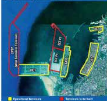
Port of Colombo container terminals

containers and each has the ability to handle the biggest ships (DROUGHTERS). The first terminal was given to China (CICT) by the then Mahinda Rajapaksa government in 2013 with 85% equity for 25 years and within five years this terminal has reached a design capacity of 2.4 million TEUs but may have an operational capacity of well over 3 million giving enough time till early part of 2018 to provide services to mega ships without major delays.